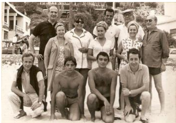
Fig.1. Famosos en Benidorm