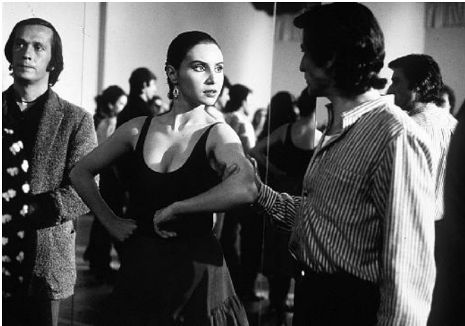
Fig. 8. Paco de Lucía, Laura del Sol i Antonio Gades.

També van fitxar per a treballar a La Galana a Chus, madrilenya. Aquesta estava casada amb Pancho Company , bateria del grup Tickets , antecedent del grup Asfalto , que acompanyen Vainica Doble en una nova temporada de Fábulas per a TVE d'on inclouen en el seu primer single el tema El rigor de las desdichas . Pancho col·labora com a bateria en varis dels seus discos fins al final de la carrera de Vainica Doble.