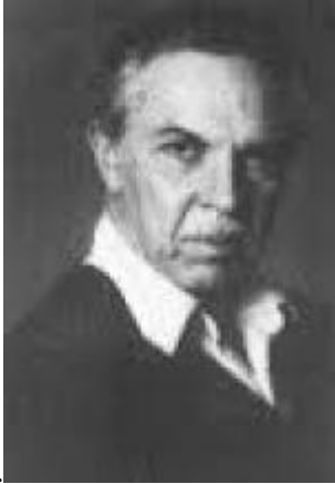
Fig. 3. Alberto Lorca

Alberto Lorca , (Alberto Nicols van Aerssen), va comprar casa en el casc antic, era un coreògraf de gran prestigi, que va muntar balls per a films de Rocío Dúrcal , Sara Montiel , Raphael i Ava Gardner . Va ser fundador en 1975 del Ballet Nacional Festivals de España , que ha estat la gènesi i base de l'actual Ballet Nacional de España .