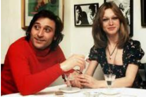
Fig. 2. Antonio Gades i Pepa Flores Marisol