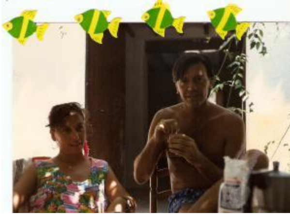
Fig.12. L'actor Josep Mª Flotats amb una amiga en una casa d'Altea.