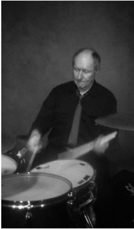
Fig. 23. Geoff Britton , ex-bateria de Wings i Manfred Mann